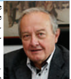
Mario Sepi Presidente del CESE

Il Trattato afferma che il Comitato Economico e Sociale Europeo (CESE) assiste le Istituzioni europee nell'elaborazione della legislazione fornendo pareri nei casi previsti dallo stesso Trattato, su richiesta delle Istituzioni e di propria iniziativa. In realtà, il Comitato svolge, nella preparazione della legislazione, un ruolo molto più sostanziale rispetto alla definizione di "assistenza alle istituzioni" contenuta nel Trattato. Durante il mio mandato di Presidente del Comitato, voglio far crescere ulteriormente questo ruolo nel contesto del dialogo interistituzionale.